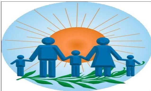
Общественные организации (советы) района

Ирбейская местная организация ВОИ «Всероссийское общество инвалидов»