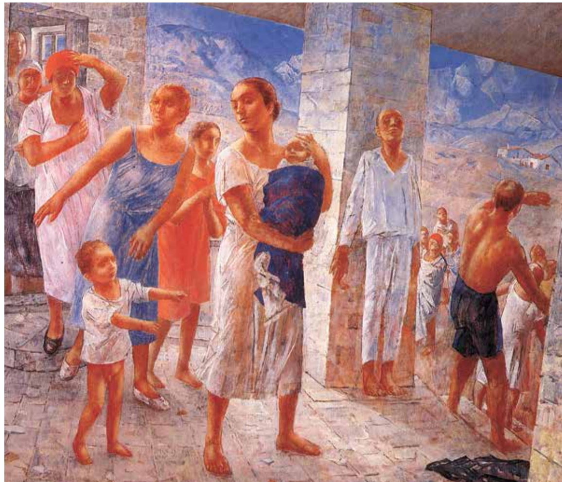
Кузьма Петров-Водкин. Землетрясение в Крыму. 1927

цу. Трубы летят с крыш, вообще жутко было. Папа отвел меня в сторону, а там уже какая-то трещина. В общем — страшно. Мама пришла, тоже стояла. Люди уже стали уезжать, паника была, в общем — жуть. Папа спрашивает: «Что, мы поедим?» А мама говорит: «Нет, мы останемся. Такое событие раз в жизни бывает, все-таки мы вместе, и это очень интересно». И он стал рисовать картину в это время, в землетрясение. У меня, когда я смотрела, как он ри-