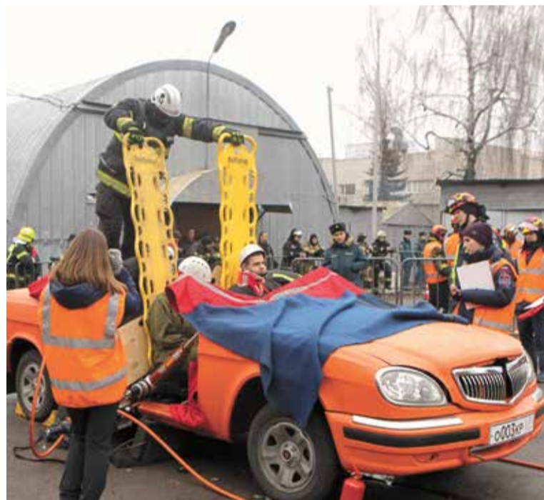
Правильное извлечение пострадавшего из разбитого автомобиля — непростая задача, при решении которой важна каждая мелочь