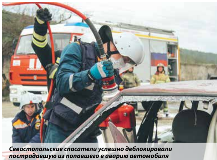
Севастопольские спасатели успешно деблокировали пострадавшую из попавшего в аварию автомобиля

ями Карламан и Приуралье на нерегулируемом железнодорожном переезде произошло ДТП с участием электрички и легкового автомобиля. В результате погибли два человека, еще один серьезно пострадал. Прибывшие сотрудники МЧС деблокировали погибших и не допустили разлива топлива.