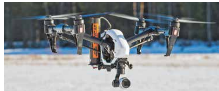
Первое место в номинации «Оперативная деятельность» получило предложение по усовершенствованию беспилотника

тия, Красноярскому краю, Ямало-Ненецкому автономному округу, Курганской области. Проявили высокую активность и ведомственные вузы — Академия гражданской защиты, Ивановская пожарно-спасательная академия ГПС, Сибирская пожарно-спасательная академия ГПС и Уральский институт ГПС.