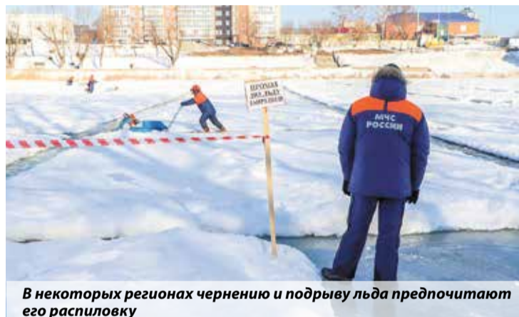
В некоторых регионах чернению и подрыву льда предпочитают его распиловку

Для безаварийного пропуска паводка проводятся чернение и распиловка льда, взрывные работы на затороопасных участках. В период весеннего половодья для оперативного мониторинга обстановки на реках запланирована работа 52 гидропо-