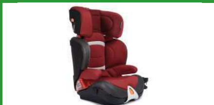
Автокресло группы III для детей массой 22-36 кг (возможно использование бустера)